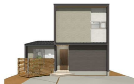
※外観パースはイメージです。

1F床面積/57.41㎡ (17.36坪) 2F床面積/39.74㎡ (12.02坪) 延床面積/97.15㎡ (29.38坪) 施工面積/99.22㎡ (30.01坪) 敷地面積/172.52㎡ (52.18坪)