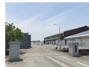
大門中学校 約1,000m 徒歩約13分