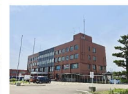
子育て支援センター 約240m 徒歩約3分