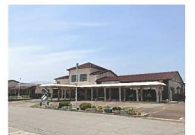
大門きらら保育園 約680m 徒歩約9分