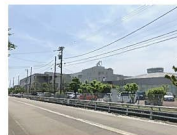
大門小学校 約350m 徒歩約5分