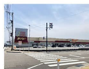
サンコー 約1,100m 徒歩約14分