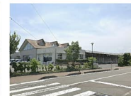
大門わがば幼稚園 約650m 徒歩約9分