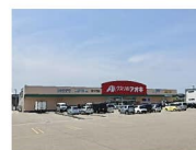
クスリのアオキ 約1,100m 徒歩約14分