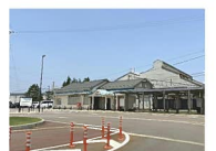
あいの風とやま鉄道 越中大門駅 約1,440m 徒歩約18分