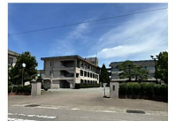
庄西中学校 約1,700m 徒歩約22分