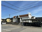
JR油田駅 約800m 徒歩約10分