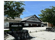
砺波東部小学校 約800m 徒歩約10分