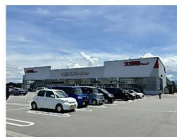
大阪屋ショップ 約900m 徒歩約12分