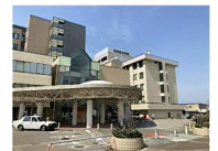
砺波総合病院 約2,600m 徒歩約33分