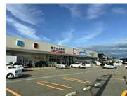
ウェルシア 約900m 徒歩約12分