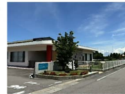
あぶらでん認定こども園 約200m 徒歩約3分