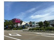
イオンモールとなみ 約2,700m 徒歩約34分