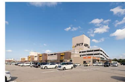
アビタ 富山東店まで約900~1130m