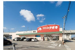
クサリのアオキ 鍋田店まで約490~720m