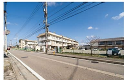
広田小学校まで約650~860m