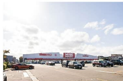
イオンタウン上飯野まで約1070~1300m