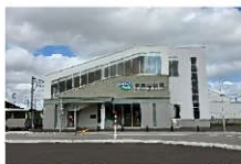
新富山口駅/約40~380m (徒歩1~5分)