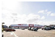
イオンタウン/約1070~1300m 上飯野