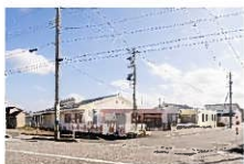
ひろたこども園/約550~830m