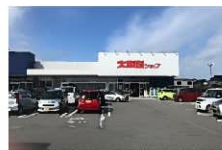
大坂屋ショップ/約1370~1600m 上飯野店