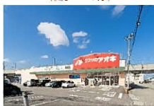
くすりのアオキ/約490~720m 鏡田店

【ウォークヒルズ新富山概要】 ●所在地：富山県下富原字稲荷1番7外 ●開発面積：48,946.99㎡ ●総区画数：113区画 ●今回販売区画数：81区画（一部オダケホーム建築条件付区画） ●地目：宅地 ●販売面積：200.04㎡（60.51坪）～378.24㎡（114.41坪） ●開発許可番号：富山指令建指第649号（R05開発019） ●都市計画区域：市街化区域 ●用途地域：準工業地域（但し、地区計画および建築協定による制限あり） ●道幅：60m ●容積率：200% ●道路：幅員6.0m、7.0m、9.0m（舗装道路） ●消費税込完成 ●水道：富山市公営上水道 ●排水：公共下水道 ●電気：北陸電力 ●ガス：都市ガス ●施設：公園1ヶ所、コミュニティセンター1ヶ所、調整池4ヶ所、ゴミステーション3ヶ所 ●負担金：上水道加入金82,500円/区画、下水道受益者負担金440円/㎡、消費負担金200,000円/区画、コミュニティセンター建設負担金200,000円/区画 ●造成工事完了：2024年7月予定（第1工区2024年3月、第2工区2024年7月予定） ●売主：オダケホーム株式会社