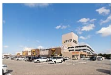
アビタ富山東店/約900~1130m