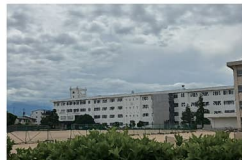
新庄中学校まで約3000～3230m