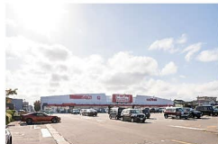
イオンタウン上飯野まで約1070～1300m