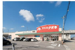
クサリのアオキ 鍋田店まで約490～720m