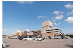
アピタ 富山東店まで約900～1130m