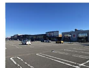
イータウン大島 約640m~730m 徒歩約8分~10分