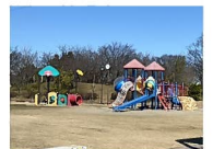
大島中央公園 約720m~800m 徒歩約9分~10分