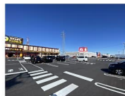
アイタウン射水 約240m~440m 徒歩約3分~6分