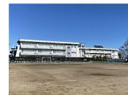
大門中学校 約2,600m~2,700m 徒歩約33分~34分