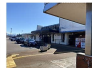
あいの風富山鉄道小杉駅 約1,600m~1,700m 徒歩約20分~22分