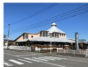
大島つばさ保育園 約380m~470m 徒歩約5分~6分