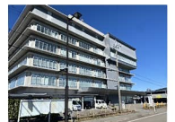
射水市役所 約640m~730m 徒歩約8分~10分