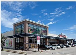
どんたく西南部店まで 約350m(徒歩約5分)