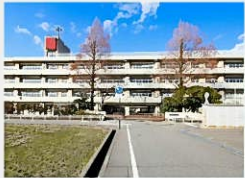
金沢市立西南部小学校まで 約500m(徒歩約7分)