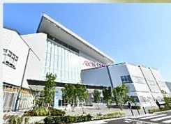
イオンモール白山まで 約2900m(車で約10分)