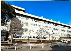
金沢市立西南部中学校まで 約400m(徒歩約5分)