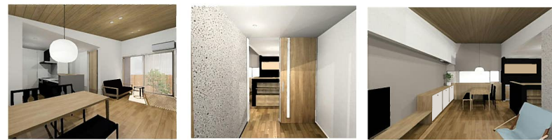
※外観・内観パースはイメージです。

1F床面積/57.41㎡(17.36坪) 2F床面積/39.74㎡(12.02坪) 延床面積/97.15㎡(29.38坪) 施工面積/99.22㎡(30.01坪) 敷地面積/172.52㎡(52.19坪)