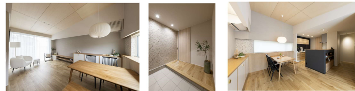
※外観・パースはイメージです。

1F床面積/57.41㎡(17.36坪) 2F床面積/39.74㎡(12.02坪) 延床面積/97.15㎡(29.38坪) 施工面積/99.22㎡(30.01坪) 敷地面積/172.52㎡(52.19坪)