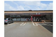
セブンイレブン 高岡城東店まで 約590m (徒歩約8分)