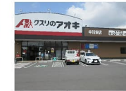
クスリのアオキ 中川栄店まで 約450m (徒歩約6分)