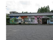
JR水見線越中中川駅まで 約350m (徒歩約5分)