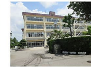
高陵中学校まで 約1,010m (徒歩約13分)