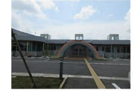
定塚保育園まで 約510m (徒歩約7分)