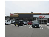
アルビス丸の内店まで 約1,200m (徒歩約15分)