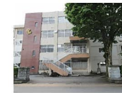
高陵小学校まで 約610m (徒歩約8分)