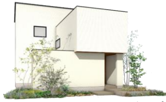
パースはイメージ

三方の窓から光を採り込み、外とのつながりを感じるプランムダゼロ動線と、すっきり機能的な収納で、身軽に暮らす自然光と穏やかに調和する北欧モダンデザイン