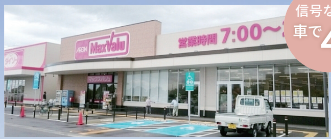
マックスバリュ黒部コラーレ前店 (約1,000m)

⑩ 8号線沿いで、アクセス良好 スーパー・ホームセンター近く 毎日の買い物に便利！